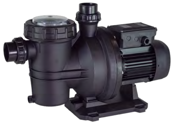
Tabla de características