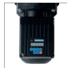
Controlador Integrado de Fácil Acesso