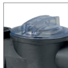
Tampa do pré-filtro de torção, transparente