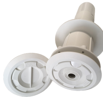
A - Passamuro de rosca 30 cm