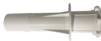
B - Passamuro de rosca 30 cm